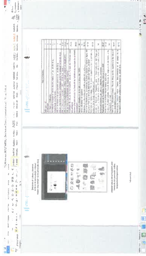
Captura de Pantalla Informe Anual 2020